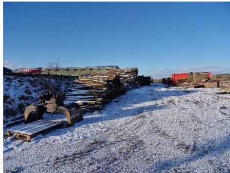
Opgeslagen spullen achter loods