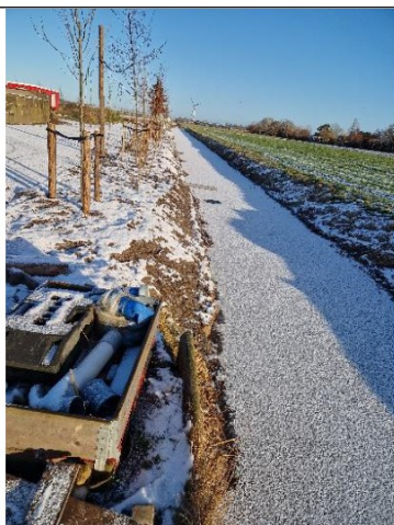
Bomen en beschoeiing