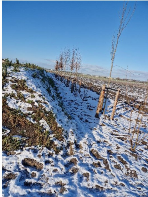
Bomen en aarden wal