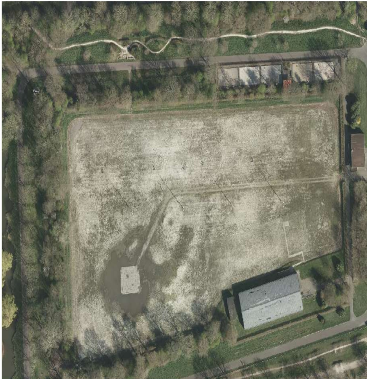
Wielersbaan Nassaupark te Bovenkarspel