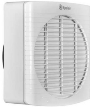
voorbeeld aangeboden ventilator