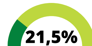
Aangifte van online aankoopfraude