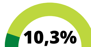
Aangifte van gehackt account

Uit de veiligheidsanalyse blijkt ook dat inwoners informatie willen inwinnen over het maken van meldingen bij de gemeente. De inwoners moeten zich gehoord voelen door de gemeente. Het moet dan ook duidelijk zijn hoe zij de gemeente kunnen bereiken. Als gemeente willen we onze bereikbaarheid vergroten en assertief reageren op meldingen.